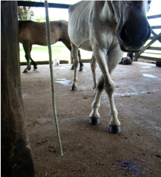
Fig.5. Dificuldade na correção da postura no teste de cruzamento dos membros anteriores (Equino 3).

mesma enzima no Equino 3 (2,4mg/dL), que normalizou-se às 72h. Houve também elevação das enzimas CK (331; 450; 253; 242 e 396 U/L) e DHL (593; 671; 753; 793 e 712 U/L) em todos os animais, com normalização dos valores de CK apenas nos Equinos 3 e 4 a partir das 120h e dos valores de DHL nos Equinos 1, 2, 3 e 5. Observaram-se diminuição dos níveis séricos de cálcio em todos os equinos; diminuição de magnésio nos Equinos 1, 2 e 5 e de fósforo nos Equinos 3 e 4, com posterior normalização.