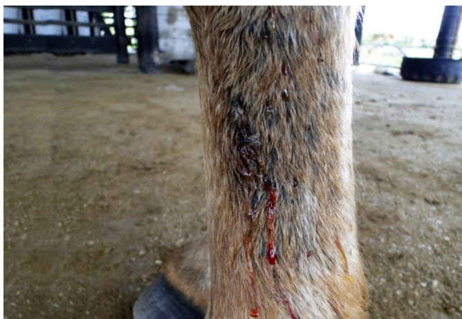
Fig.2. Líquido serossanguinolento drenando da pele íntegra (Equino 2).

Outros sinais foram apatia (Equinos 1, 3 e 4) (Fig.3), letargia caracterizada por sonolência com tendência em permanecer com a cabeça baixa (Equinos 1, 2 e 5) (Fig.4), edema nos maxilares e acima das pálpebras (Equino 1), ptose auricular (Equino 4), vasos episclerais ingurgitados (Equinos 1, 3, 4 e 5), mucosa ocular hiperêmica (Equinos 3 e 4), sangue nas narinas (Equino 4), dispneia (Equino 1), aumento de linfonodos pré-escapulares e parotídeos (Equinos 4 e 5), submandibulares (Equinos 2, 3 e 5) e pré-crural (Equino 3), e flacidez da cauda (Equino 1).