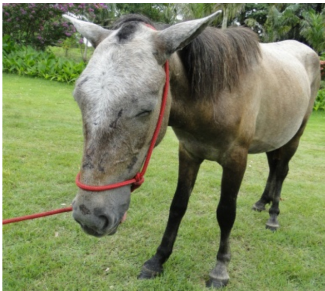
Fig.3. Apatia (Equino 4).