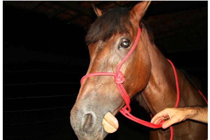
Fig.6. Redução do tônus lingual (Equino 1).

Achados de necropsia. Os achados de necropsia foram edema no local da inoculação, estendendo-se às áreas adjacentes a esse ponto (Equino 2) ou por toda a extensão do membro (Equino 1). No coração observaram-se sufusões no epicárdio do ventrículo esquerdo e direito acompanhando o sulco coronário longitudinal (Equino 1) e petéquias no sulco coronário (Equino 2). Verificou-se, ainda, grande área hemorrágica com 20 cm de diâmetro no útero (Equino 1), bexiga com áreas hemorrágicas em grande parte da mucosa (Equino 2).