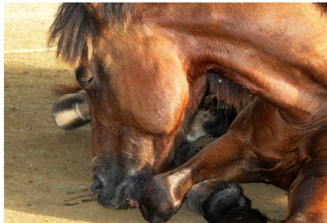
Fig.4. Dificuldade de sustentação da cabeça (Equino 1).

Verificaram-se aumento das frequências cardíaca e respiratória em todos os animais; e temperatura retal diminuída nos Equinos 1, 2 e 4, a partir das 17h47min, 6h e 18h, respectivamente, após a inoculação do veneno.